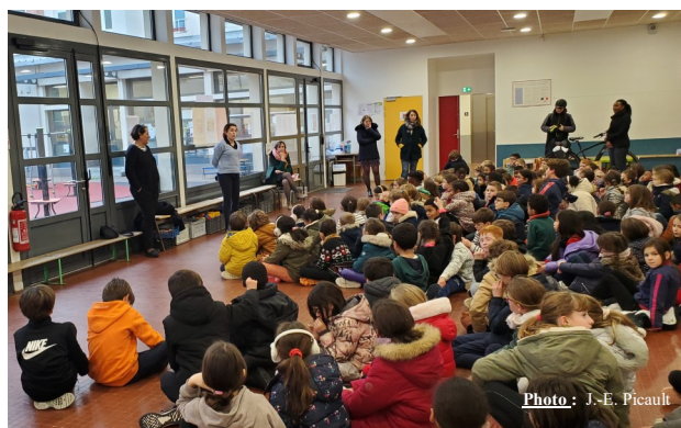
Remise des produits d'hygiène à la responsable de l'épicerie solidaire

Chaque année, nous faisons une action de solidarité. Le lundi 4 décembre, nous avons fait un temps fort où les